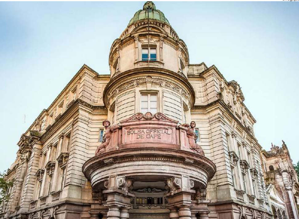
O Museu do Café está localizado na Rua XV de Novembro, 95, no Centro Histórico de Santos

Terá muito a ganhar se for mais tolerante com as pessoas do trabalho. Os astros trazem boas chances no setor financeiro, é só se ajustar e aproveitar. A pessoa amada está mais apaixonada.