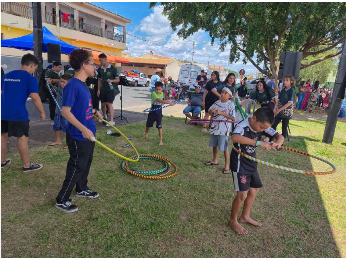
A Prefeitura reforça que o “Ibaté em Ação” segue com o objetivo de facilitar o acesso da população a serviços essenciais, fortalecendo o vínculo com os moradores e ampliando o alcance das políticas públicas. Novas edições do programa já estão previstas para 2026.

educativas. Moradores de todas as idades compareceram ao evento, aproveitando a oportunidade de resolver demandas e receber orientações sem precisar se deslocar para outros locais da cidade. Um dos destaques desta edição foi a vacinação antirrábica para cães e gatos, que mobilizou os tutores de animais de estimação do bairro e regiões próximas. Ao todo, mais de 200 doses foram aplicadas, reforçando a importância da imunização e contribuindo para a saúde pública e o controle de zoonoses no município. Além de consultas, testagens, serviços de documentação e orientações sociais, o evento também contou com atividades culturais, recreativas e com atrações circenses, tornando o ambiente acolhedor e atrativo para famílias. Segundo a organização, a satisfação do público foi evidente e a ação é considerada um sucesso.