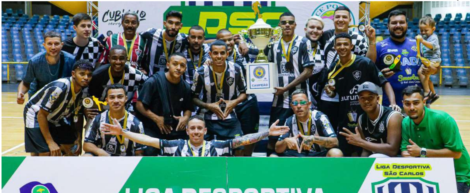
Jogadores do Botafogo comemoram o título: campeão de 2025

Com o encerramento da competição, a LDSC conclui sua penúltima disputa oficial de 2025 e agora se prepara para a tradicional Copa São Carlos de Futebol de Campo. Para 2026, a Liga já anuncia duas competições de futsal