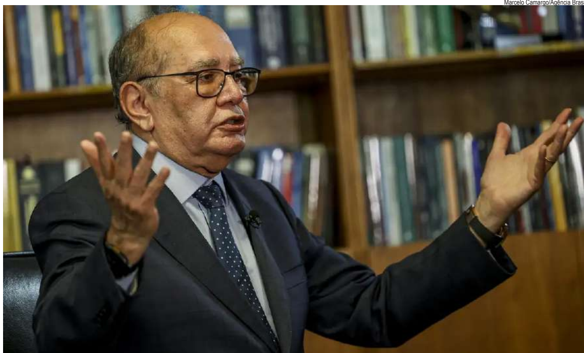
Marcelo Camargo/Agência Brasil

Ministro do STF acatou pedido da Advocacia do Senado