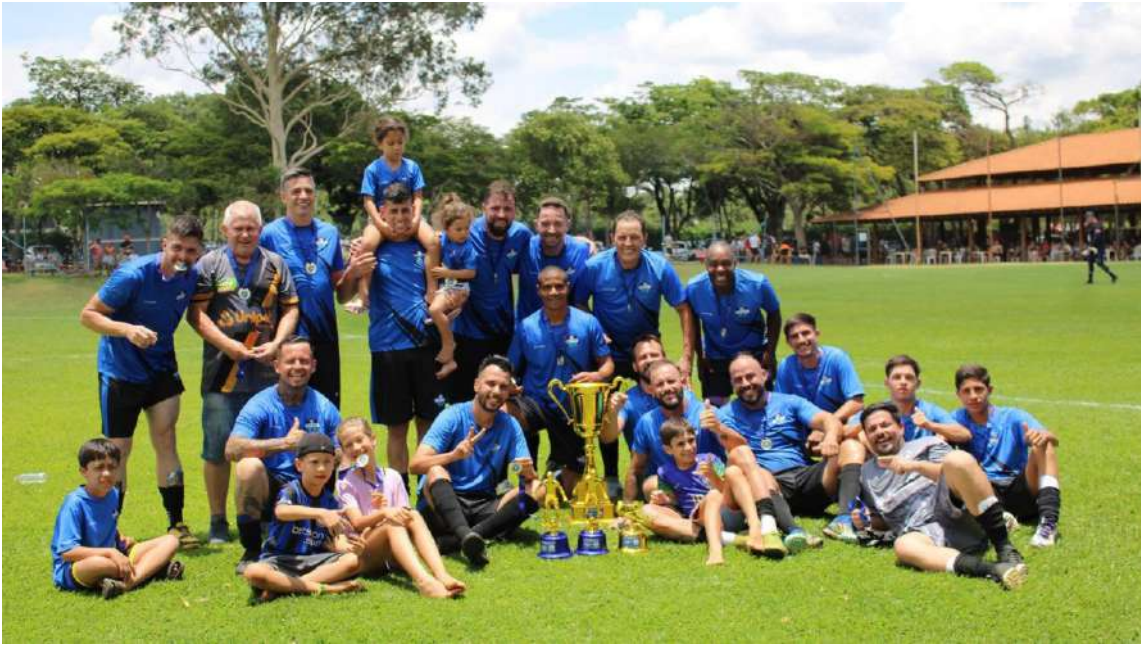
Unipet comemora o título, com direito a goleada na final