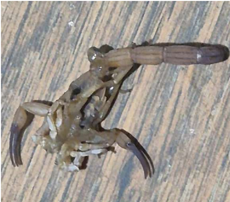
Escorpião foi capturado no quarto onde estava uma criança

Um morador residente na rua Helder Candido Martinez, no Jardim Acapulco, em São Carlos, entrou em contato ontem (17) com o Jornal Primeira Página para relatar problemas relacionados à infestação de escorpiões e ao mato alto em terrenos e praças próximas à sua residência.