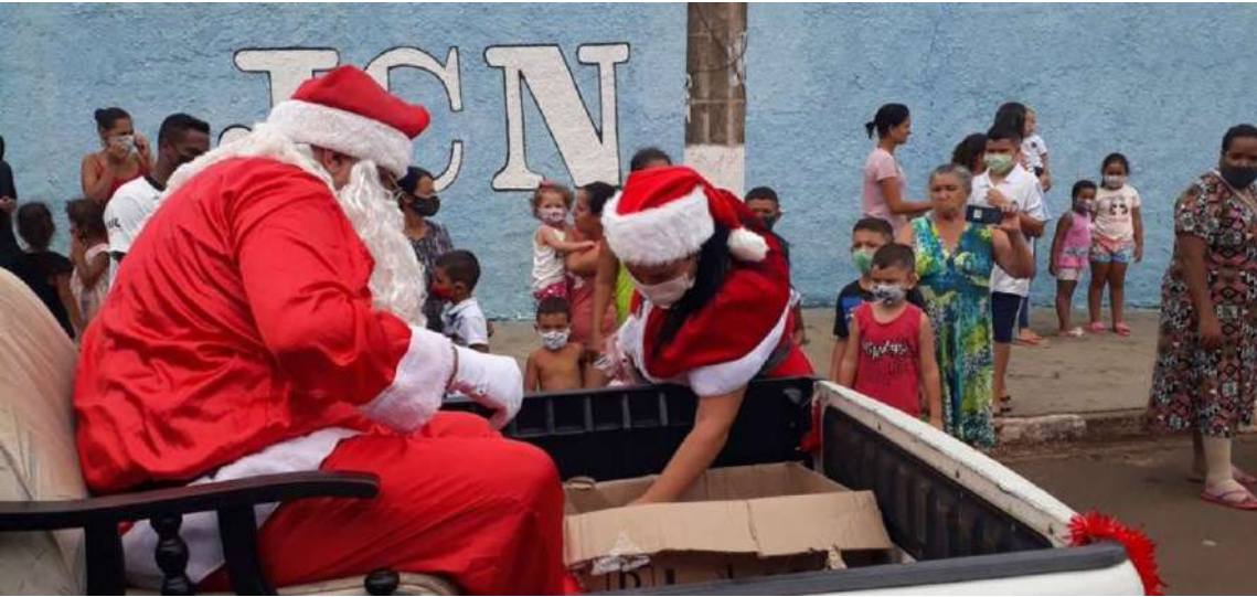
Um dia repleto de luz, felicidade e muita magia natalina