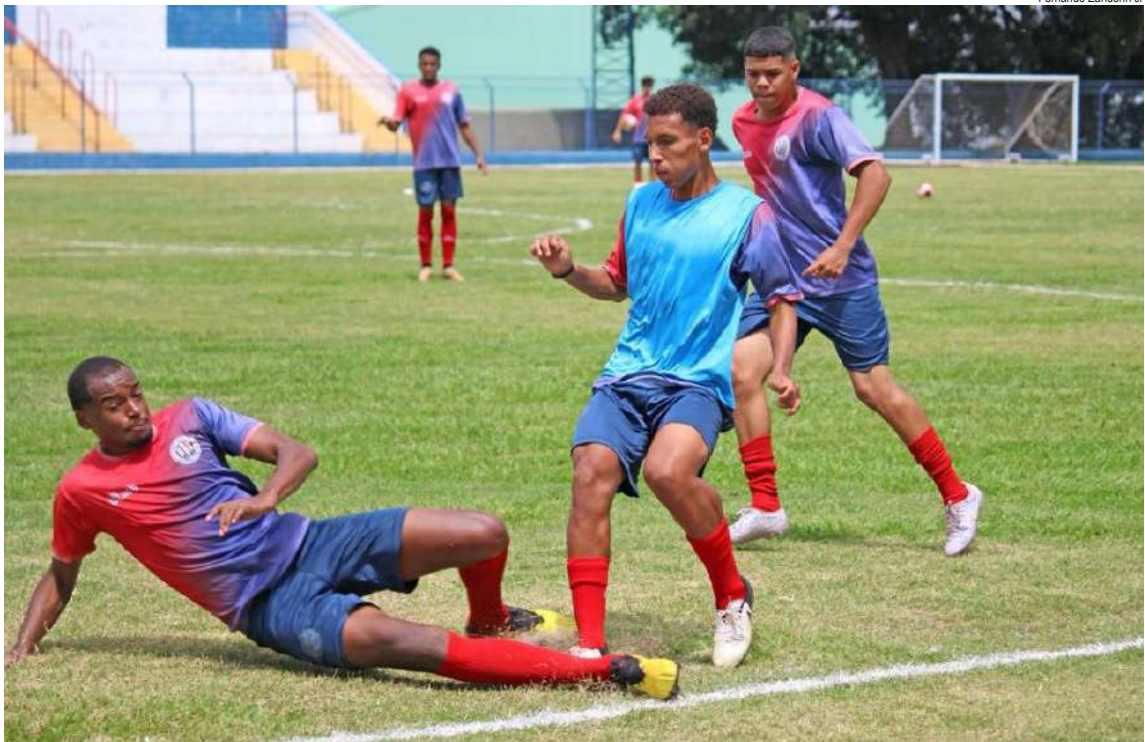
Equipe treina forte, se preparando para ir longe na Copinha

Quarta-feira, 7 de janeiro – a partir das 17h15