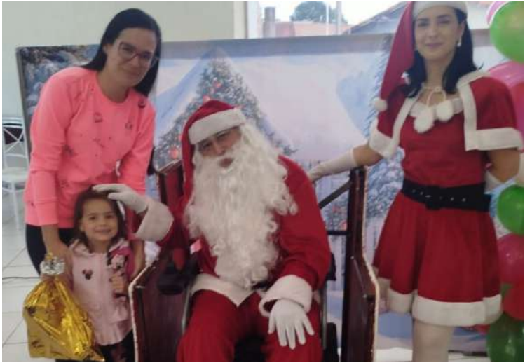
Momento de muita empatia entre Papai Noel e uma criança: amor e carinho

O Natal Solidário da ONG MID, realizado no domingo, 14, no Salão de Festas do Nosso Lar, foi marcado por uma tarde de amor, inclusão e muita alegria para crianças e adultos com necessidades especiais.