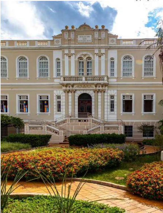
Colégio Santa Marcelina, em Botucatu, um dos locais que integra a rede de cidades locação

“A ampliação da São Paulo State Film Commission fortalece o audiovisual como cadeia produtiva e cria novas oportunidades para os municípios, movimentando a economia