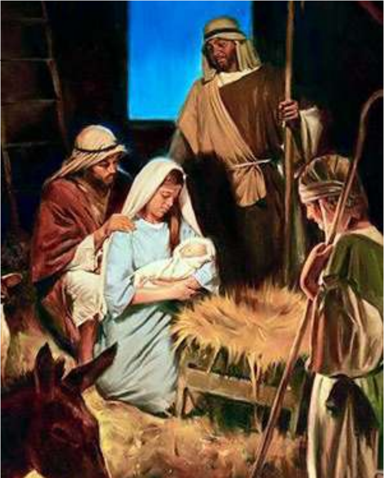
A preparação para o Natal se reveste de um caráter permanente, pois o Senhor Jesus está sempre conosco, mas ao mesmo tempo, a sua presença se renova através dos Sacramentos especialmente na Liturgia. Prepare seu coração para viver um Santo Natal.