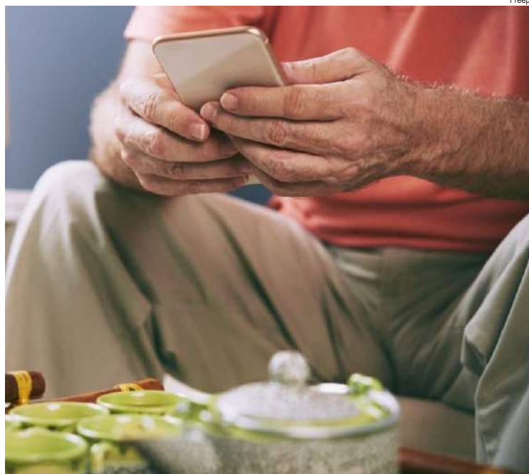
Em mais um estelionato, idoso perdeu mais de R$ 8 mil em São Carlos

Um idoso de 70 anos registrou na CPJ de São Carlos um boletim de ocorrência por estelionato, após sofrer um golpe que resultou em um prejuízo de R$ 8,7 mil. O crime ocorreu um dia após o Natal, envolvendo contato realizado por meio do aplicativo de mensagens WhatsApp.