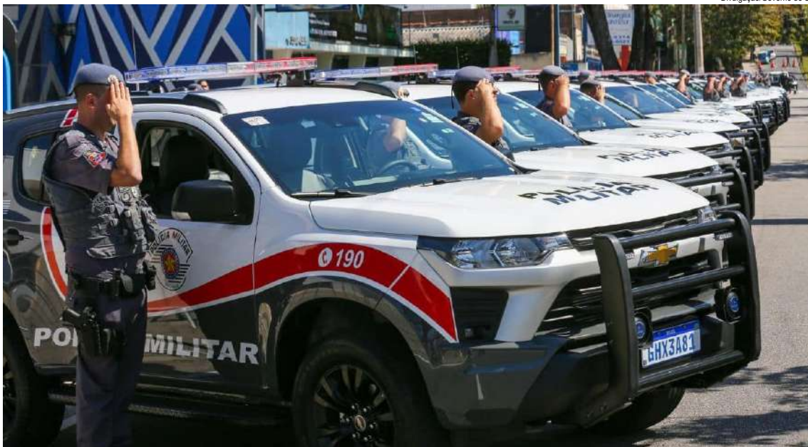
As prisões envolvem delitos como tentativa de estupro e homicídio, roubo e furto a residência

Outro caso ocorreu em Taubaté, no sábado (27), quando policiais militares abordaram um beneficiado da