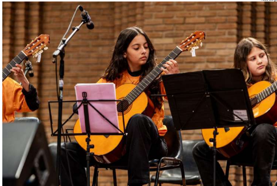
Orquestra de Cordas do GURI São Paulo

Em 2026, programa de educação musical cresce em 20% no número de polos para atender mais estudantes a partir dos 6 anos de idade