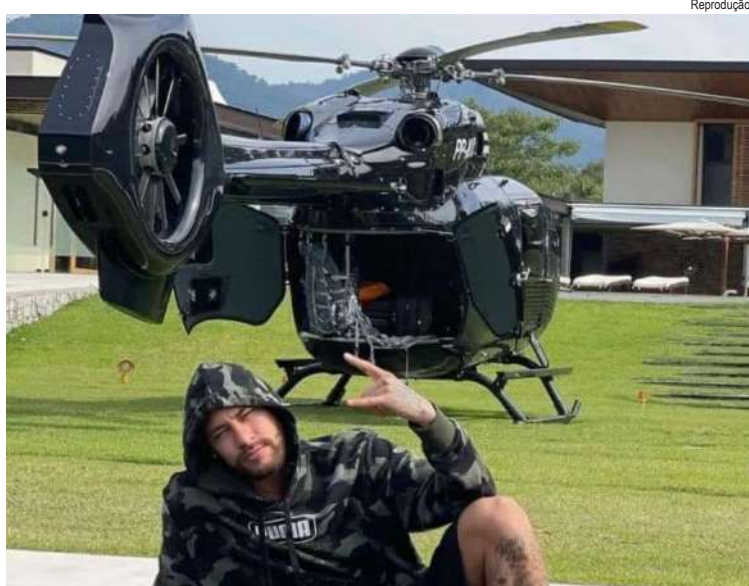
Os artigos luxuosos do atleta foram personalizados na cor preta e com referência ao Batman

O atacante acertou a renovação de contrato com o clube paulista até o final de 2026. Foi o terceiro acordo da camisa 10 desde o retorno ao Santos, na temporada passada.