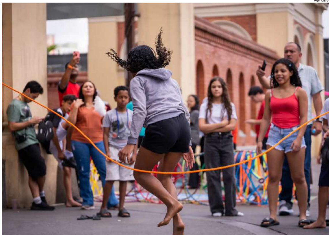
Programação tem novidades no litoral e no interior

O CULTSP na Estrada, projeto do Governo do Estado de São Paulo, continua em janeiro com a carreta itinerante “Museu Catavento: Ciência que vai até você”. A unidade móvel recria parte do acervo do museu com nove experiências interativas nas áreas de física, química, biologia, geografia e história. Nos próximos