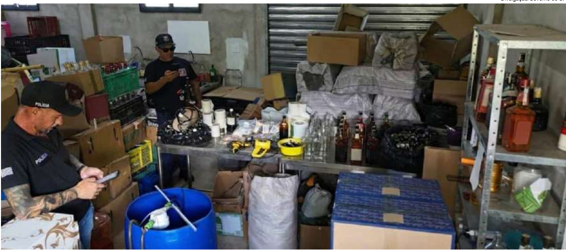
Agentes cumpriram três mandados de busca e apreensão, expedidos pela Justiça de São Paulo no município de Rio Claro

funcionaria uma indústria clandestina de bebidas alcoólicas falsificadas. Durante a operação, um homem de 29 anos e uma mulher de 26 foram presos em flagrante. Eles foram encaminhados à delegacia e responderão por crimes contra a saúde pública, relações de consumo e contra a propriedade material e industrial. A polícia aponta que a dupla seria responsável pela fabricação e comercialização clandestina das bebidas. No local, os agentes apreenderam dois veículos e uma motocicleta utilizados nas entregas, além de mercadorias sem procedência, recebidas como forma de pagamento pelas bebidas falsificadas. Também foram recolhidos R$ 72 mil em dinheiro, insumos, equipamentos e diversos materiais usados na produção e venda ilegal dos produtos. As investigações continuam para identificar outros envolvidos e apurar a extensão do esquema, que representa grave risco à saúde pública e à ordem econômica.