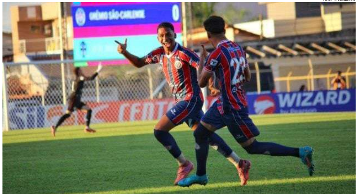
Torcida espera comemorar gol e vitória dos Jovens Lobos

Questionado sobre a falta de um futebol mais vistoso até