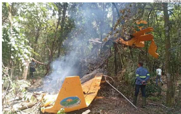
Defesa Civil de Tambaú

Um avião monomotor caiu na manhã de ontem em uma lavoura de cana-de-açúcar, em Tambaú. A aeronave pegou fogo depois da queda. As chamas foram controladas. Segundo a Defesa Civil de São Paulo, o piloto do avião conseguiu sair antes do início do incêndio. Ele foi socorrido por