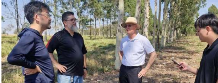
Visitantes internacionais no sistema integrado com árvores

Dezenove missões estrangeiras buscaram soluções brasileiras na Embrapa Pecuária Sudeste