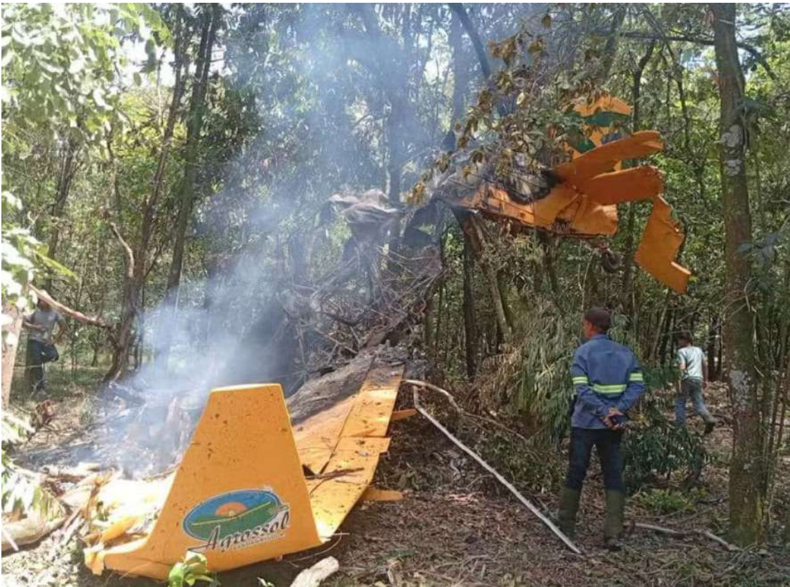
De acordo com as primeiras informações, a aeronave é um avião agrícola monomotor, utilizado para pulverização em lavouras