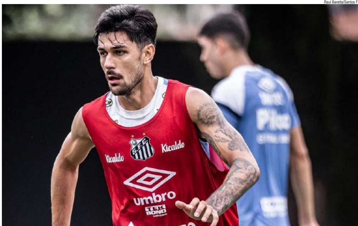
Raul Baretta/Santos FC

“Maia um exemplo de “herança maldita” de gestões passadas que tumultuam e dificultam demais o trabalho de