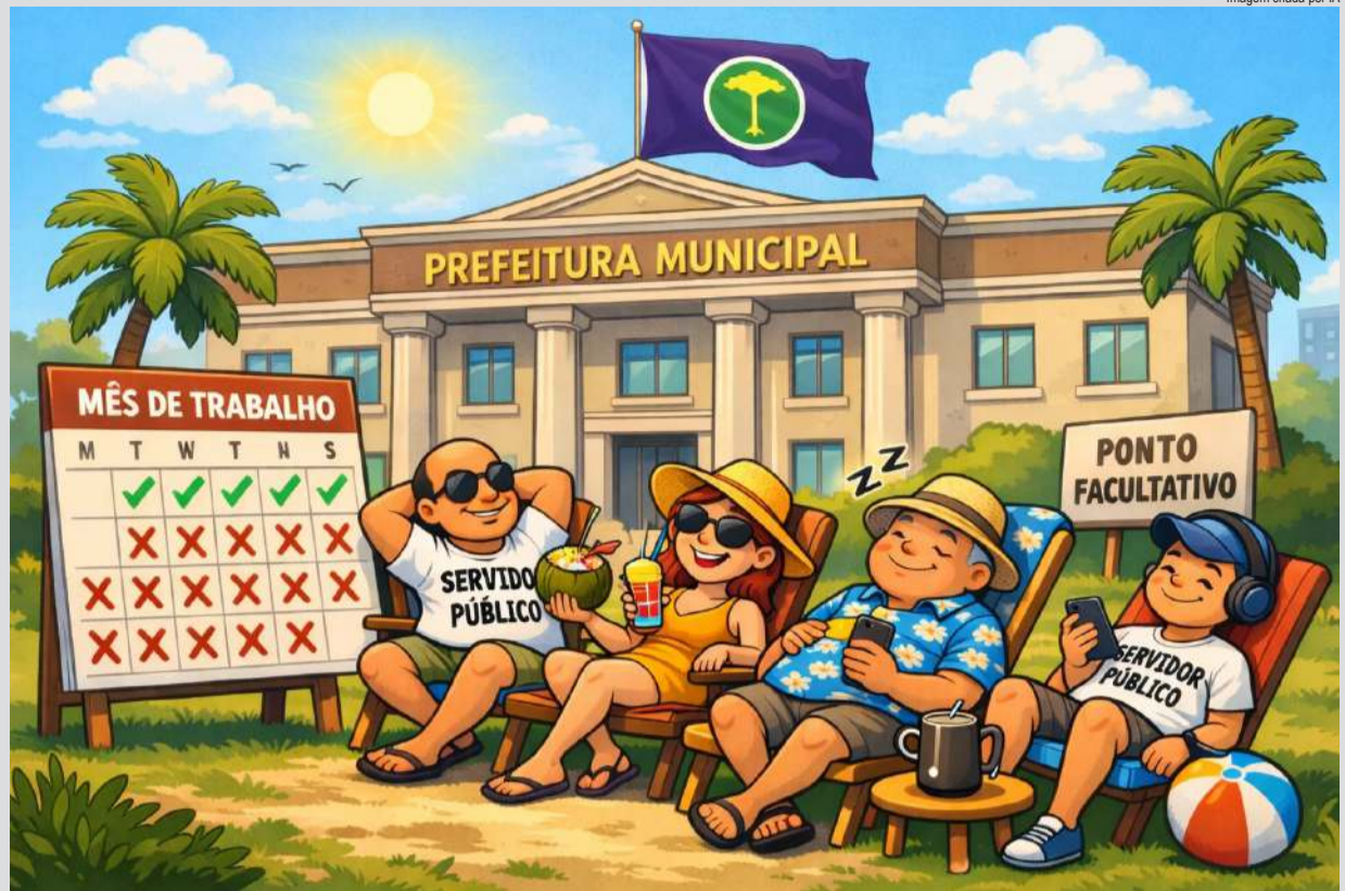
Imagem criada por IA

Câmara e Prefeitura viraram mãe, avó e madrinha. Em dezembro, o servidor público [com exceção dos serviços essenciais] trabalhou apenas 15 dias. Em novembro, foram 16 dias. Janeiro promete ser de 20 dias e fevereiro apenas 17 dias de “trabalho”. Tudo isso com salário em dia e café passado.