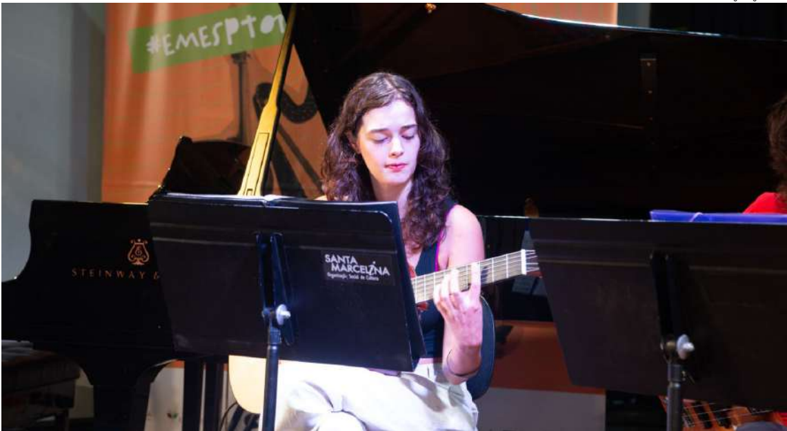
Aluna da Emesp Tom Jobim