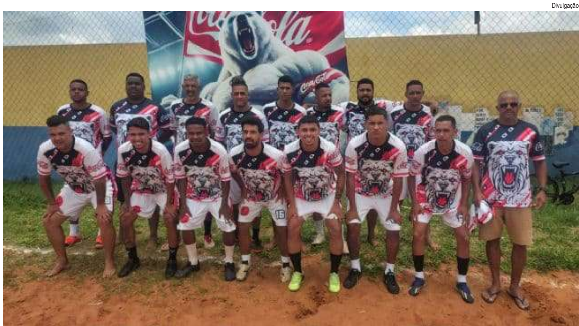
Coca Cola conseguiu a primeira vitória: goleou o Canela Seca por 5 a 0