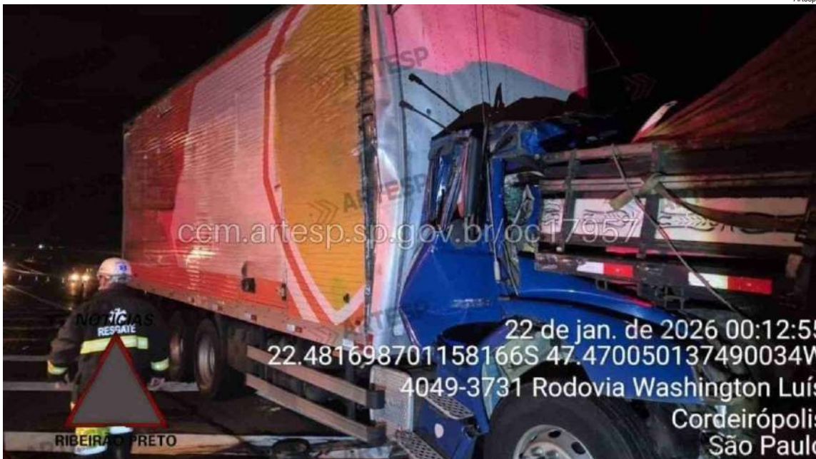
Acidente deixou um caminhoneiro morto na SP-310

A causa do engavetamento também será investigada para esclarecer o que desencadeou a sequência de colisões.