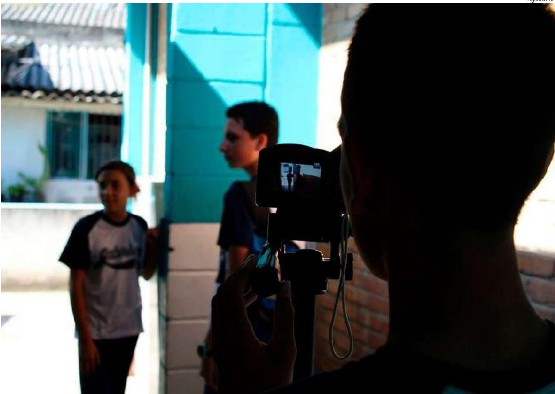
Programa engloba orientação e desenvolvimento de curtas

Confira aqui a lista completa: Adamantina; Americana; Amparo; Anhumas; Aparecida; Araçatuba; Arujá; Bariri; Barretos; Barueri; Bastos; Bilac; Birigui; Bocaina; Boituva; Botucatu; Bragança Paulista; Brotas; Buritama; Caçapava; Cajamar; Campos do Jordão; Cananéia; Caraguatatuba; Colina; Cotia; Cravinhos; Divinolândia; Dois Córregos; Eldorado; Espírito Santo do Pinhal; Francisco Morato; Garça; Guaiçara; Guaiçara; Guararema; Guaratinguetá; Guariba; Herculândia; Hortolândia; Iguape; Ilha Solteira; Ilabela; Indaiatuba; Iracemápolis; Itanhaém; Itapetininga; Itatiba; Itu; Jaboticabal; Jahu;