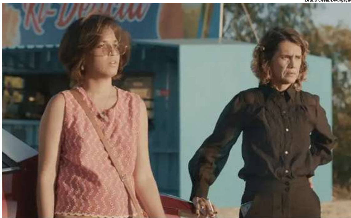
Exibições vão até 31 de janeiro e têm entrada gratuita, dentre os filmes da lista, consta 'Ao Sabor das Cinzas'