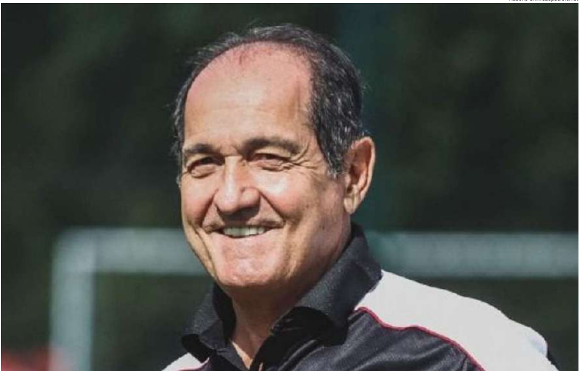
Muricy tem histórico recente de problemas de saúde e não quer se desgastar

dezembro do ano passado justamente porque passou por uma cirurgia no joelho esquerdo. Terá, também, de ser submetido a um outro procedimento no joelho direito. Rafinha é bem avaliado pela diretoria e pode se tornar o novo coordenador são-paulino. Em entrevista ao Estadão revelou que tinha recebido propostas para começar uma nova carreira fora do campo e pretendia aceitar alguma das ofertas no início deste ano. “Posso dizer que estão vindo grandes possibilidades”, limitou-se a dizer Rafinha. “Auxiliar é bacana, diretor esportivo seria bacana também porque tenho liderança, sei falar a língua dos jogadores, aprendi muito no futebol europeu, tenho muito pra compartilhar”. Rafinha, de 40 anos, foi capitão durante a maior parte de sua passagem de três temporadas pelo São Paulo. Em 2023, teve papel importante no título da Copa do Brasil. “O pessoal sabe o que posso acrescentar nos clubes. Às vezes chega clube da primeira divisão, é difícil falar toda hora ‘não’. Uma hora tenho que falar ‘sim’, tenho que encarar. Provavelmente em janeiro vou estar de volta ao futebol”, acrescentou o ex-jogador.