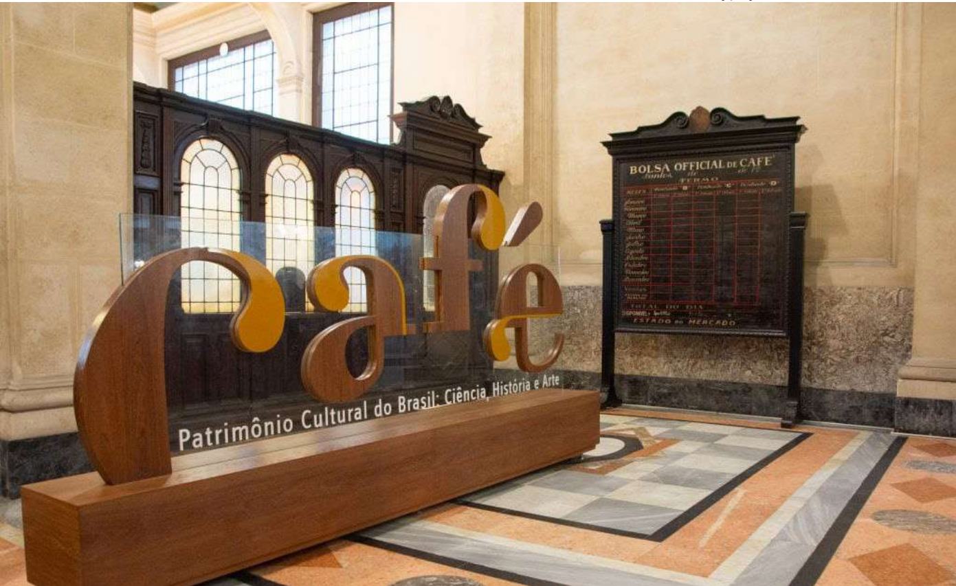
Museu do Café, localizado no centro de Santos

Entre atividades estão dicas para melhorar a qualidade do café, incluindo experiências que unem pão de cará