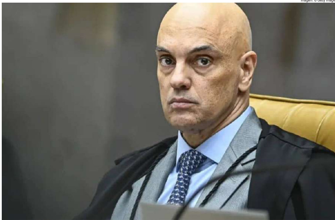
Imagem: © Getty Images