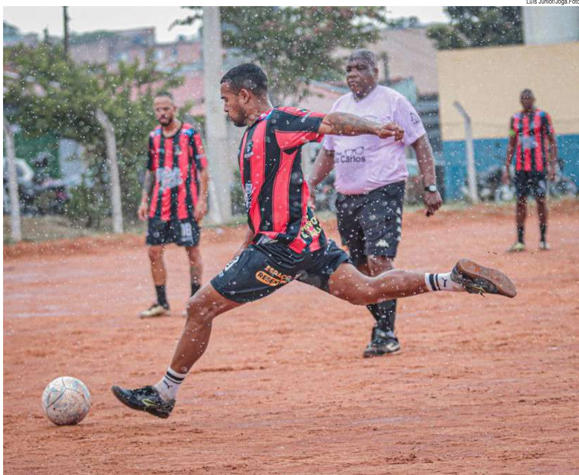
Raspadão promete muita intensidade neste final de semana

Com rivalidade, tradição e muita bola no pé, o domingo promete arquibancada cheia, emoção do primeiro ao último jogo e a certeza de que o Raspadão segue como um dos campeonatos mais vibrantes do futebol amador de São Carlos.