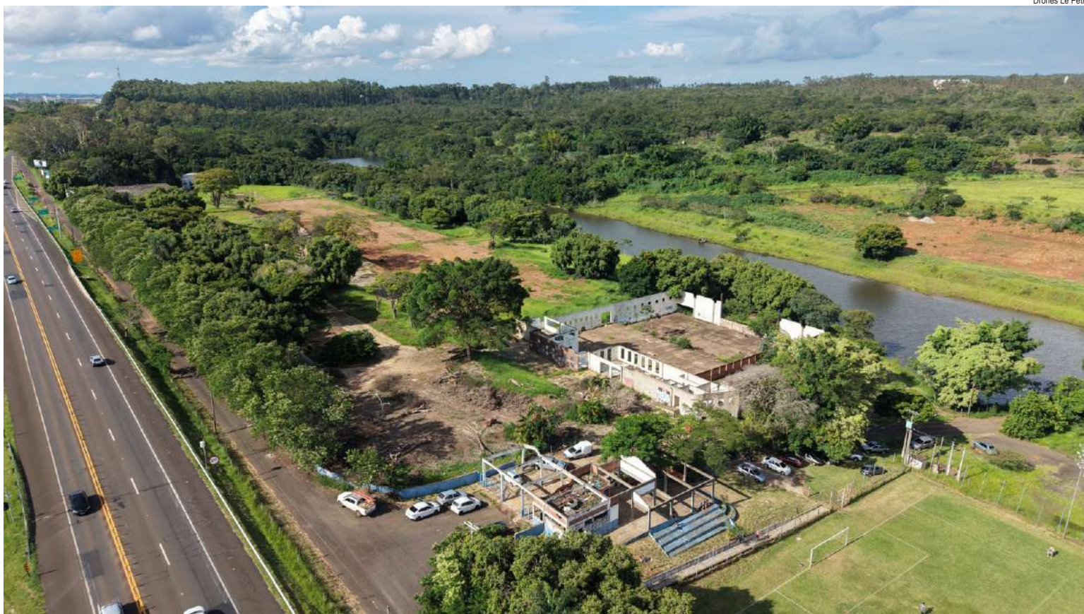
Drones Le Petit