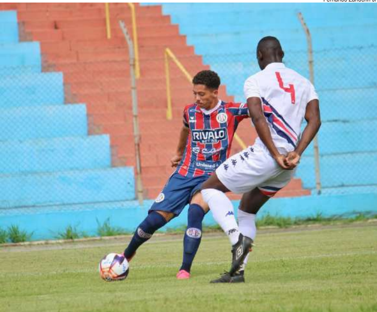
Animado com a campanha, Grêmio promete sufocar o Comercial

Lobão joga para seguir no G8 da Série A4