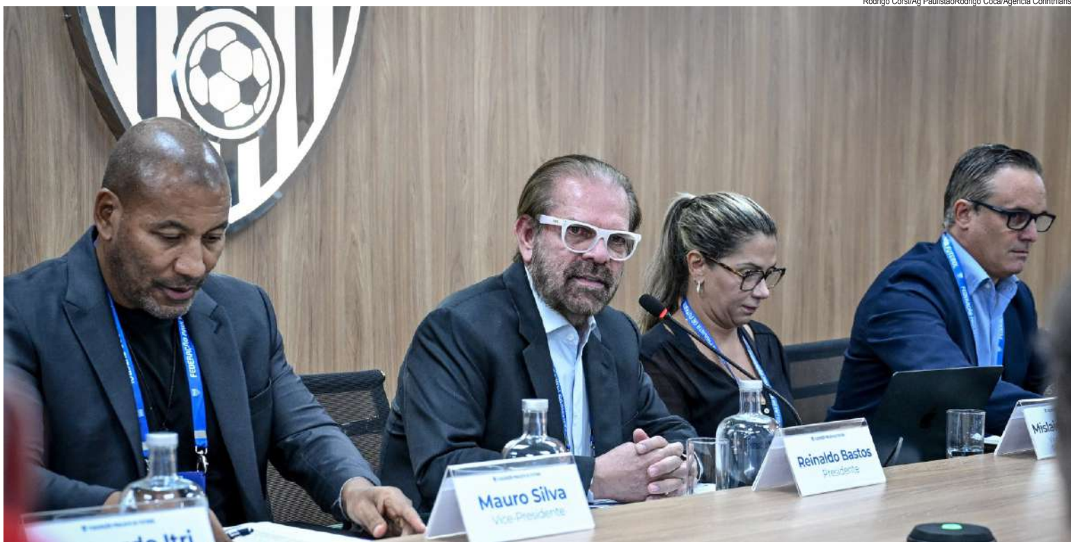
Congresso técnico definiu como será a Bezinha deste ano

O regulamento permite a inscrição de até 26 atletas