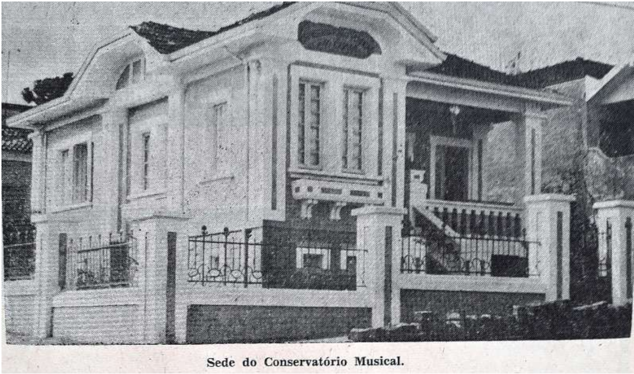
Sede do Conservatório Musical.

Além das aulas, o Conservatório promovia recitais, palestras e concursos. Recebeu artistas e grupos de renome e instituiu prêmios anuais, como o Professor Antonio Munhoz e o Celso Fontoura Costa. Mantinha ainda bolsas para alunos sem recursos,