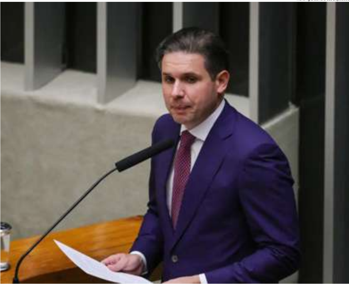
Presidente da Câmara, Hugo Motta (Republicanos-PB), precisaria de uma pauta positiva para marcar sua gestão

O argumento governista encontrou base no estudo do Instituto de Pesquisa Econômica Aplicada (Ipea), que avaliou que o impacto da redução da jornada de trabalho para 40 horas semanais é similar ao de