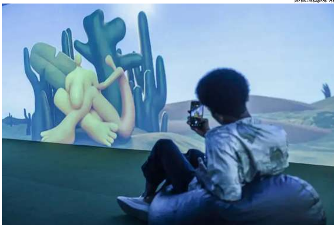
Joédson Alves/Agência Brasil

Rachel Vallego considera que as obras de Tarsila conseguem atravessar o tempo e se